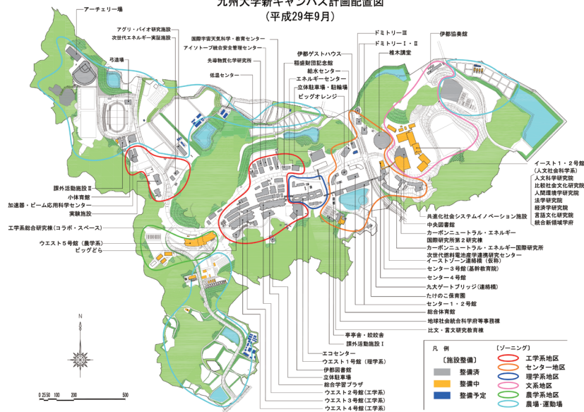
九州大学新キャンパス計画配置図 (平成29年9月)