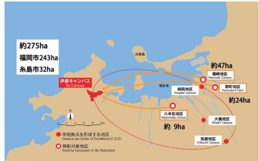
■九州大学のキャンパス計画マップ

都市の近郊という利便性を持ちながら、玄界灘に望む豊かな自然が残された静謐な環境にあります。また、ここは、古くから朝鮮半島などからの往来が盛んであったことを示す遺跡が数多く存在する歴史